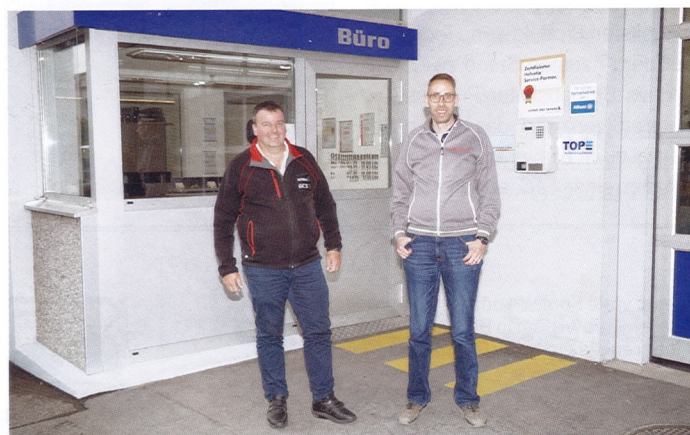
... und die Carrosserie Wesemann AG in Zug (seit 2019).